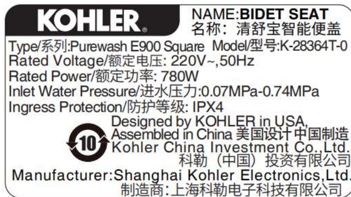
覆盖型号 K-28364T-0 铭牌