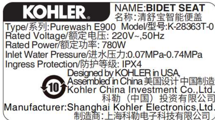
覆盖型号 K-28363T-0 铭牌