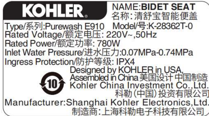
主检型号 K-28362T-0 铭牌